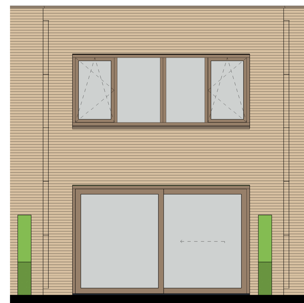
Achtergevel (optie 1)