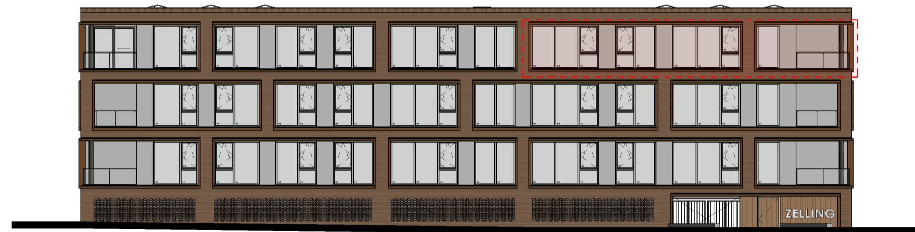
Linkergevel (entree stalling) Gevels schaal 1:200