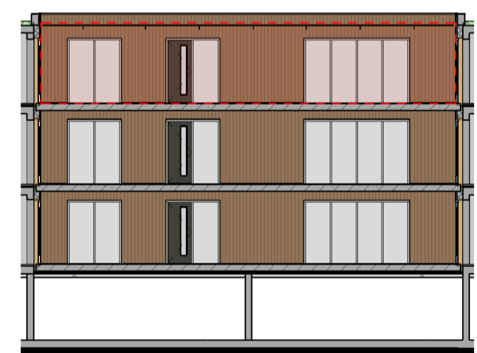
Binnengevel achterzijde Gevels schaal 1:200

WTW ventielen in badkamers, toiletten en alle verblijfsruimten staan niet op plattegrond tekening, maar zullen wél worden geplaatst.