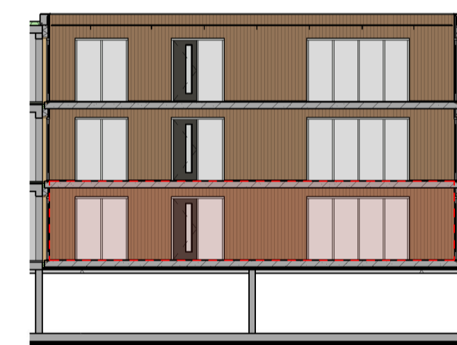
Binnengevel achterzijde Gevels schaal 1:200

WTW ventielen in badkamers, toiletten en alle verblijfsruimten staan niet op plattegrond tekening, maar zullen wél worden geplaatst.