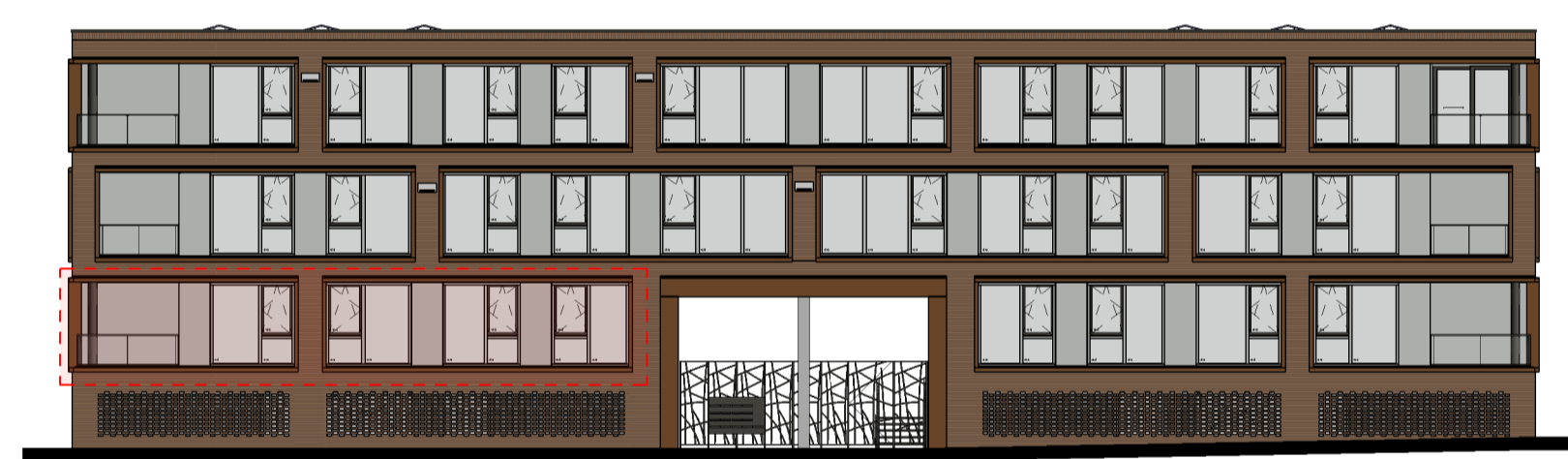
Rechtergevel (entree) Gevels schaal 1:200